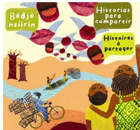
Fig. 1. Portada del libro Historias para compartir .

Además, como resultado de este proyecto, Historias para compartir es también un libro audiovisual e ilustrado (Fig. 1), donde se pueden contemplar y leer cinco de los relatos recogidos durante el proyecto, convertidos en cuentos ilustrados y cortometrajes de animación.