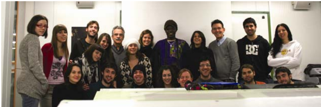
Fig. 9. Alumnos de la asignatura Proyectos II de Animación , Facultad de Bellas Artes, Universitat Politècnica de València, curso 2010-2011.

Durante la ejecución de este proyecto hemos podido comprobar que los proyectos de cooperación al desarrollo cuentan con muy buena aceptación por parte de los alumnos, porque es una manera de ponerse en contacto con otras culturas tan diferentes como accesibles, tan remotas como cercanas si se trabaja en equipo.