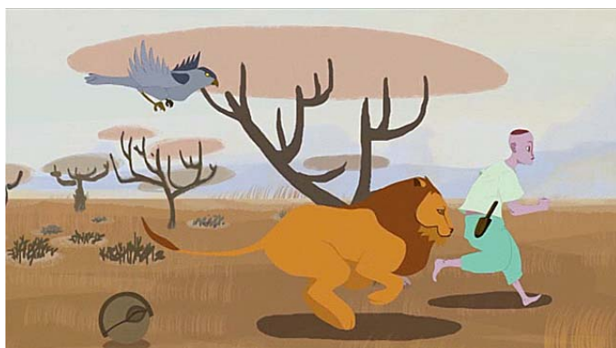
Fig. 2. Imagen del cortometraje Zanké y la serpiente , realizado en Valencia, 2010.

Pero el poder del cuento va más allá del deleite y el entretenimiento, Según Prada-Samper (2009: 212):