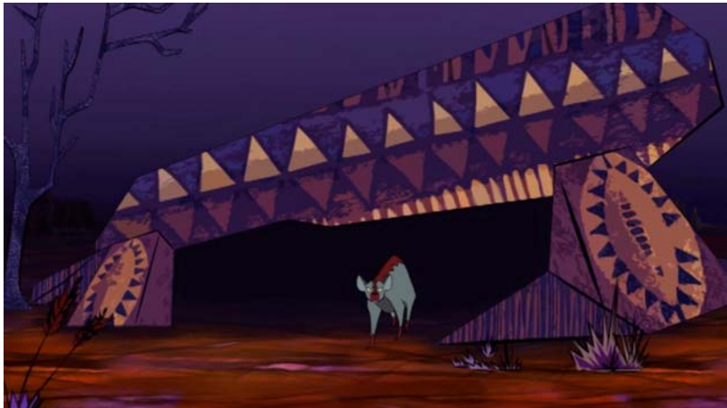
Fig. 7. La liebre y la hiena , realizado en Valencia, 2010.

Los alumnos del Conservatorio han realizado dos cortometrajes (Figs. 5 y 6): Mamari y los genios del río ( Mamari ni Ba fano ) y Awa y el hipopótamo sagrado ( Awa ni mali ). Estos cuentos fueron recogidos en Segou, la segunda ciudad más importante de Malí. Históricamente, Segou fue la capital de uno de los imperios más poderosos del territorio, que fue gobernado por Mamari Biton Coulibaly. Mamari y los genios del río es una historia que pertenece al género de la epopeya, y se corresponde con uno de los pasajes más conocidos de la Epopéya Bambara de Segou. Awa y el hipopótamo sagrado es una conocida historia sobre las terribles consecuencias de la envidia. Para su puesta en escena audiovisual se han utilizado diferentes técnicas de animación, como el stop-motion utilizando recortes, o la animación digital. Para la sonorización de las piezas contamos con diversos músicos y actores del conservatorio, que ofrece ambas especializaciones.