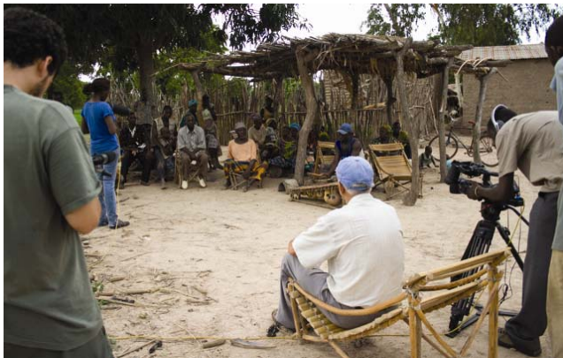
Fig. 3. El nsiirindala o informante dispuesto a comenzar su narración.

Agencia Española de Cooperación al Desarrollo (AECID) y con la colaboración de otras entidades, como la Facultad de Bellas Artes de San Carlos, el Dpto. de Comunicación Audiovisual, Documentación e Historia del Arte (DCADHA) o el Dpto. de Dibujo, ambos de la Universitat Politècnica de València.