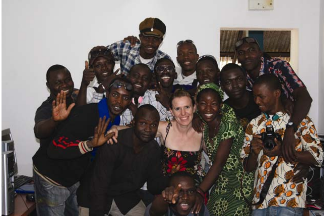
Fig. 4. Alumnos del Conservatoire des Arts et Métiers Multimédia Balla Fasseke Kouyaté de Bamako.

viva aquellas historias que habíamos escuchado. Por eso decidimos implicar a los alumnos universitarios de España y Malí y recurrimos a la animación como lenguaje de transmisión idóneo para esas historias.